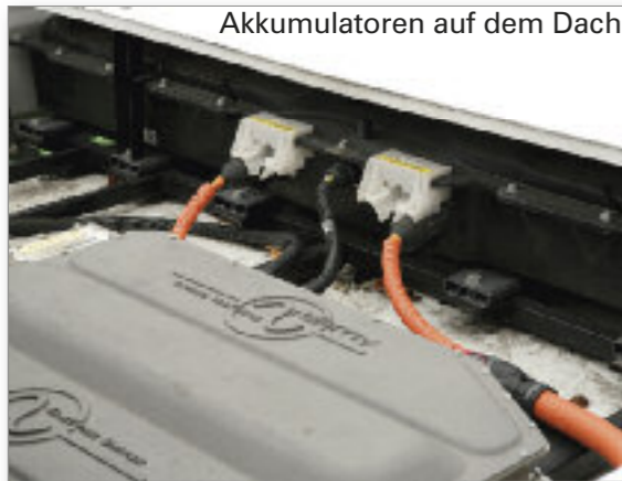
Akkumulatoren auf dem Dach

Im BOGESTRA-Hybridbus finden sich zwei Elektromotoren mit jeweils 75 KW und ein Dieselmotor. Das Grundprinzip besteht darin, dass beim Anfahren des Hybridbusses, wenn die meiste Kraft benötigt wird und der Schadstoffausstoß am höchsten ist, der Elektromotor diese Energie umweltfreundlich liefert. Der Dieselmotor läuft nur im Leerlauf mit; erst wenn eine gewisse Geschwindigkeit und Drehzahl erreicht ist, greift der konventionelle Motor im optimalen Drehzahlbereich ein. Wird der Bus abgebremst, wird dies in elektrische Energie umgewandelt, die in auf dem Dach befindlichen Akkumulatoren gespeichert und für den nächsten Einsatz des Elektromotors verwendet wird.